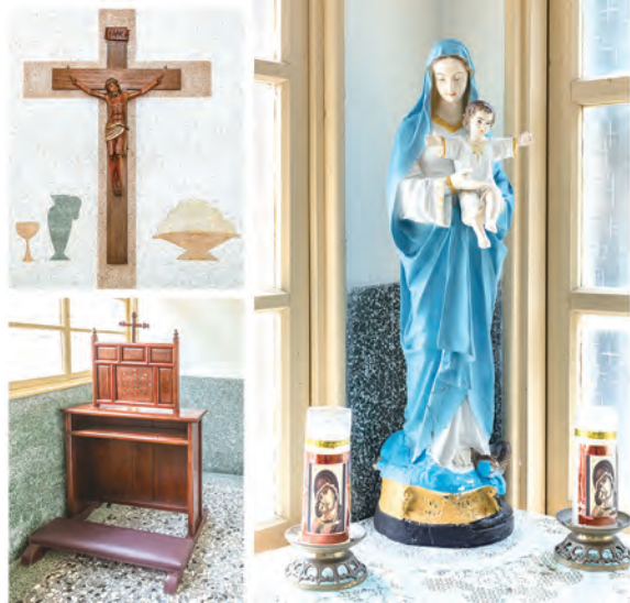
▲一月：南投赤水，天主之母天主堂（1905）