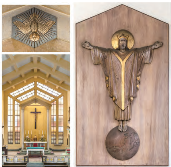
▲十一月：台中，耶穌救主主教座堂（1914）