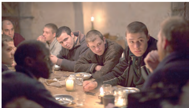
▲在團體生活中養成簡樸刻苦的習性，彼此扶持，相互關懷，使勒戒之路不孤單。

本片中的大自然美景是一大賣點，生生不息的翠綠新枝、花草爭妍等，在在使觀眾產生舒適、愉悅的