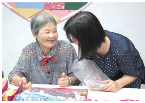
▲月雲奶奶現場示範抱枕套縫製