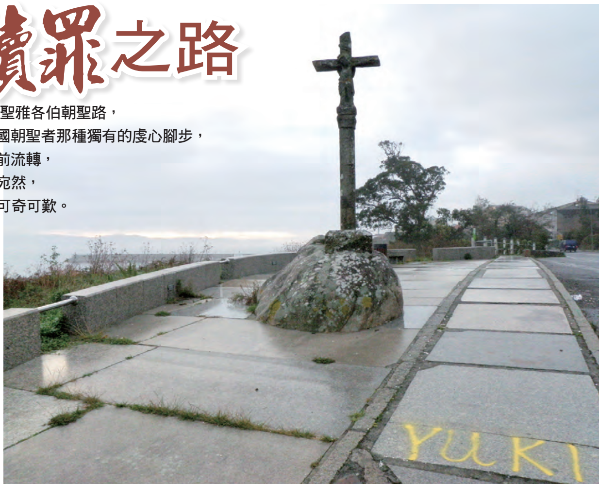
▲「海角之路」Finisterre特殊的十字架

主要盼望是為沉澱個人信仰所帶來的「贖罪」實踐，因為朝聖，我的朋友笑稱，朝聖需要這麼嚴肅以待嗎？為什麼我是要去「贖罪」？「妳沒有傷害任何人啊！」或是「妳有對不起誰嗎？」那麼，「為何要前往贖罪？」這是得忍受的疑問，以致非基督徒朋友們