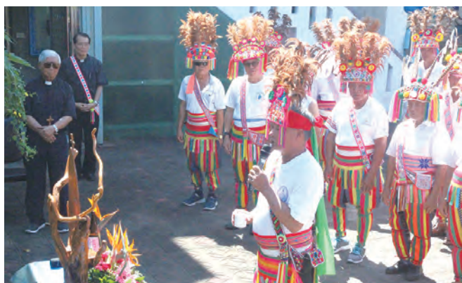
▲莊嚴隆重的祭祖靈