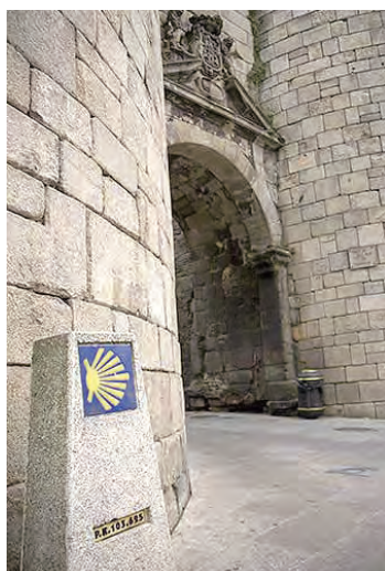
▲「原始之路」Lugo世界文化遺產城牆之門