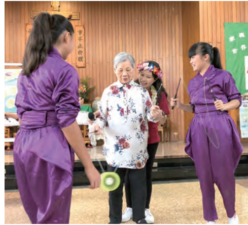
▲後龍國小扯鈴隊與失智長輩互動體驗扯鈴趣