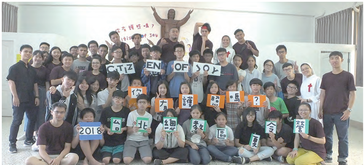
▲最後一天的共融大合照

在最後一晚的晚會當中，小組分享時，我那組的每個同學都有說到我這幾天為小隊盡了很多心力，當時心裡就在想，我真的有為小隊盡心力嗎？後來，才想到我玩遊戲時，真的很有用心的幫小隊搶分，也在晚會的表演當中，扮好我該扮演的角色，那時，我才發現我真的有盡一份心力，我真的很開心能跟那些同學一組，謝謝他們的鼓勵，也謝謝我們這隊的同學這幾天的照顧，希望下次的冬令營還能再跟你們同一組，有你們真好，謝謝你們，下次也是我最後一次參加達義營隊了，也希望我下次的營隊裡可以表現更優一點，謝謝你們。