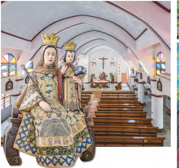
▲五月：嘉義梅山，中華聖母天主堂朝聖地（1913）