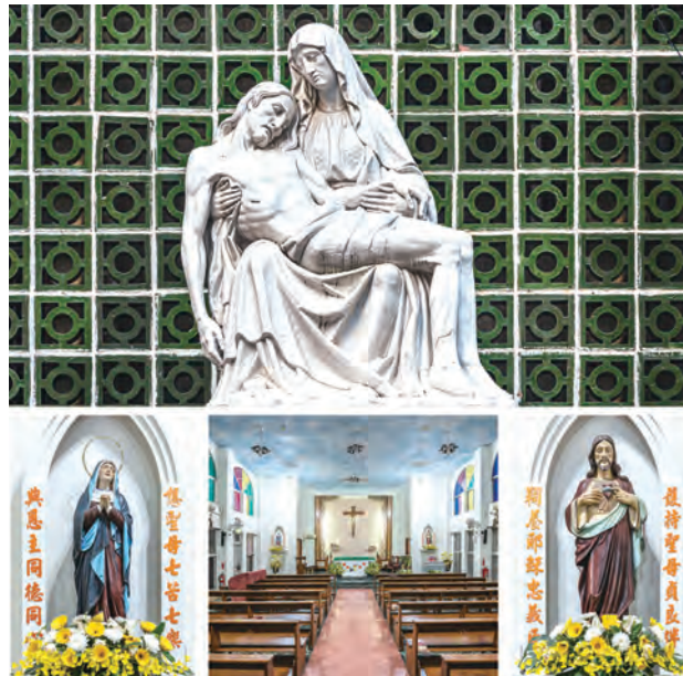
▲九月：嘉義，聖母七苦天主堂（1933）