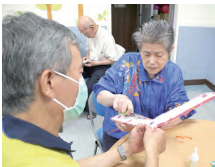
▲在志工協助下，中心水妹奶奶完成拼布之裁剪。