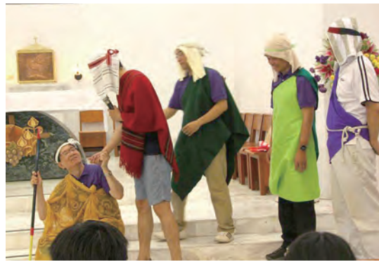
▲《宗徒大事錄》短劇以詼諧逗趣的表演，演繹伯多祿醫治癱子的故事。 ▲高福南神父在福音中勉勵教友仰賴聖母媽媽的代禱，並求主引導我們邁向復活的光榮。