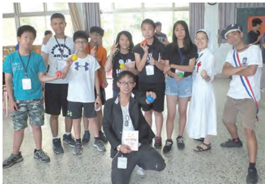
▲天國拍賣會得標小組