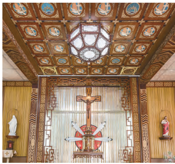
▲三月：台南新化，耶穌聖名天主堂（1905）