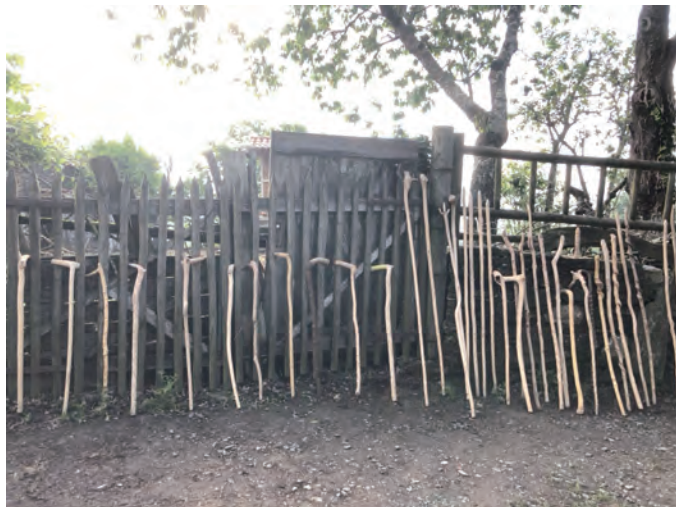
▲沿途小村兜售讓朝聖者十分便利稱手的木杖