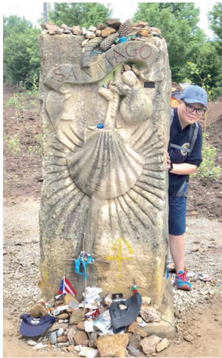
▲無數朝聖者留下的痕跡，都不及我們刻在心版上的深切省思。