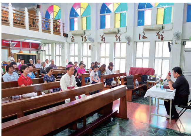
▲聖體要理講習會的參與現況

每當我們舉行彌撒聖祭就是再次宣告耶穌為我們而死，為我們受那麼多的痛苦。王神父以電影受難史的英文宣傳海報標題「Passion」，來說明對耶穌受難當時痛到極點、苦到極點，沒有言詞可以表達主耶穌對我們的愛，於是用「Passion」，這字來傳達。又舉例，每當在聖週五朝拜十字聖架時，都會有些教友因回想耶穌的苦難而哭泣，祂的的確確為我們承受巨大的苦難，這是無庸置疑的，但耶穌不要我們可憐祂，而是該深切痛悔自己的罪，並要學習在生活中背起自己的十字架，這樣才有意義。