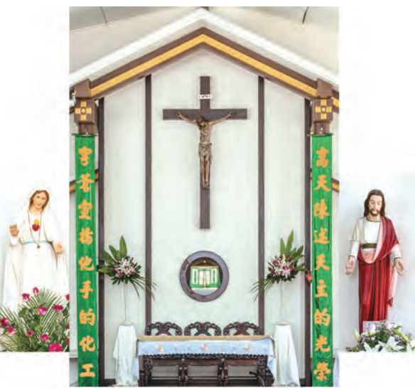
▲四月：彰化，聖十字架天主堂（1927）