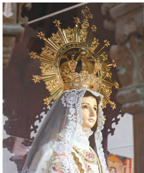
▲十二月：屏東萬金，聖母無染原罪聖殿（1861）