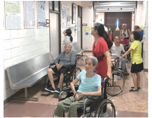
▲惠民醫院的病患、家屬及澎湖民眾，認真觀展。 ▼宜蘭頭城的教友們也特地飛到澎湖看展