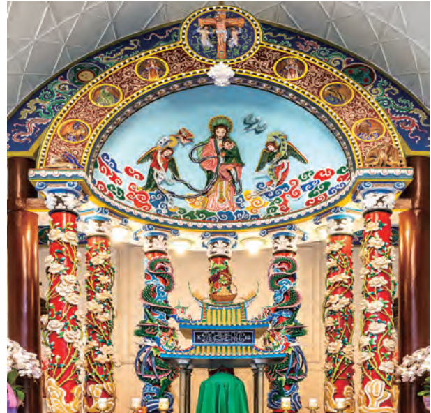
▲七月：南投竹山，玫瑰天主堂（1911）