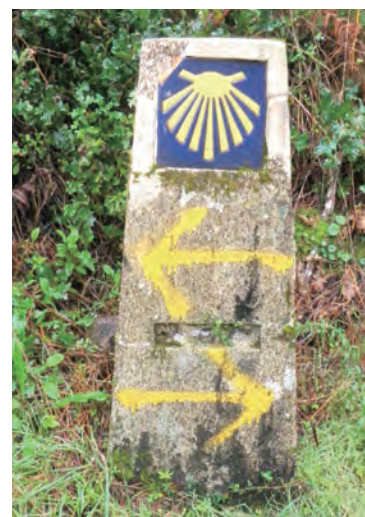
▲「海角之路」沿途雙向貝殼指標