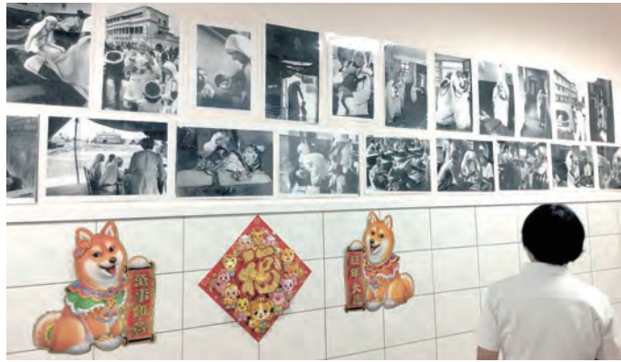
▲惠民醫院的醫護人員用心欣賞聖德蘭姆姆特展，感念仁愛傳教修女會對貧病及垂死者的愛心與耐心，有如靈醫會祖聖嘉民視病猶親的精神。