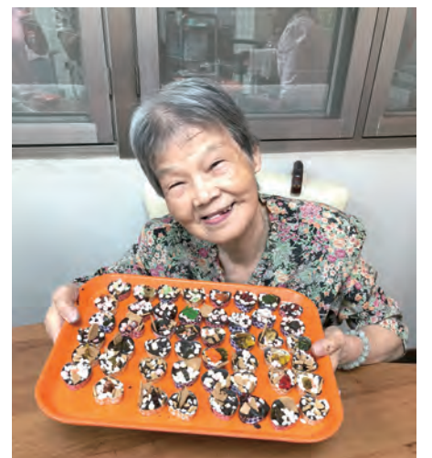
▲長輩於活動前加緊趕工巧克力，成品心意滿滿 ▲長輩親手作巧克力準備送給貴賓朋友

調退化的情形，舞蹈便是一種有趣又能發揮創造力的媒介，合適的樂曲搭配不同的肢體動作便可讓長者們練習身體與空間概念，並促進肢體功能。此外，失智症也會使時間概念、人物辨識、對環境與事物之理解、語言等能力退化，常造成失智者有焦慮不安或憂鬱的情緒。但即使到末期許多失智者仍能保有音樂與身體動作之記憶，只要聽到熟悉的樂曲，便能快速連結長期記憶，回憶起當時聽音樂的情景、歌詞內容、甚至與歌手相關的故事。另外，聽到喜愛的音樂能刺激