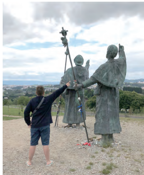
▲Monde do Gozo歡樂山最美麗的地標

看到這張朝聖證書，書寫著名字，我豁然開朗，我知道，我完成了！我終於完成了！一步一腳印的