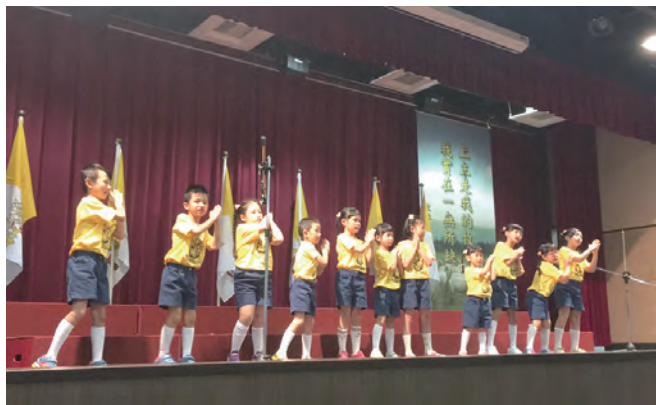
▲中華聖母主教座堂小澤溪隊表演〈可愛的小耶穌〉