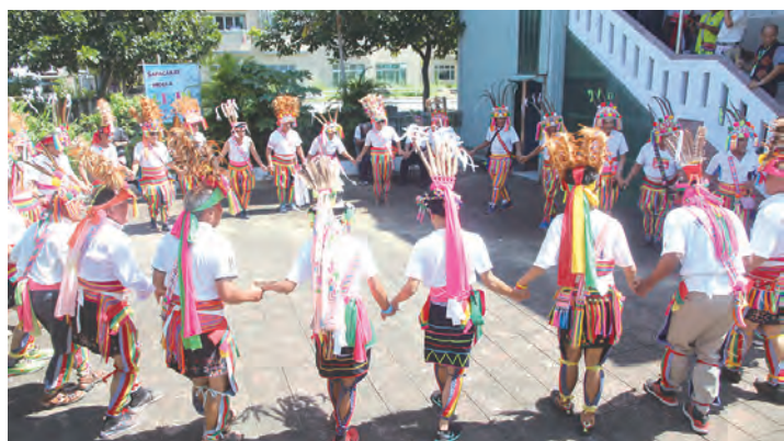
▲活力有勁的祭祖靈舞蹈

非常感動的是，今年來參與的朋友約有400多人，彌撒也有近280人參加，是近年參加人數最多的一次，我們已經連續8年舉辦，邀請原鄉的原住民朋友來台南都會區與我們共融，讓我們都會區的原住民得到很大的鼓勵。感謝所有參與次活動的工作人員及所有來參加的朋友，最感謝天主賜與所有的一切，讓活動順利完成，結束2018年第8屆「原住民族日」活動「阿美族慶豐收」，明年我們將邀請台中教區的布農族部落來共融，期待明年再相會，天主保佑大家。