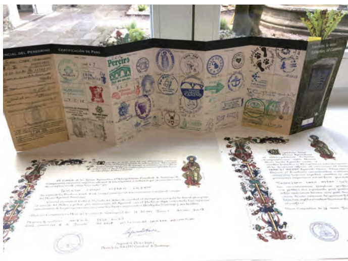
▲Camino新版朝聖證書及朝聖護照章

因為，有Camino，我得到一個重新的自己，這感恩圍繞，當然不純然是信仰事，卻不能不說是聖雅各伯特別給予朝聖者的恩典。痛苦也罷，幸運也罷，我的罪赦再度在這「沒有罪的城」的天亮時刻，畫下神聖句點。 (全文完)