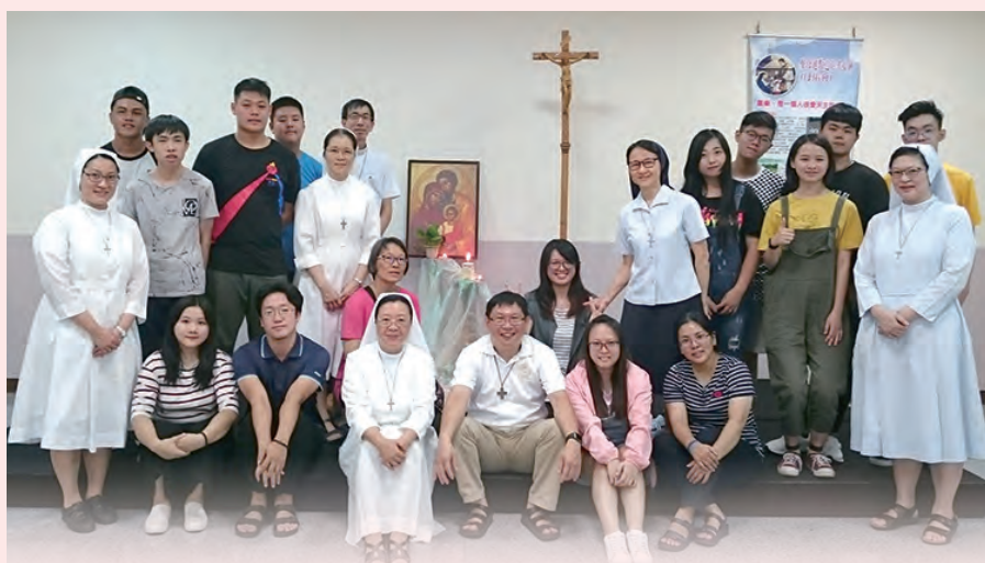
▲母佑會開放日，青年追隨耶穌。