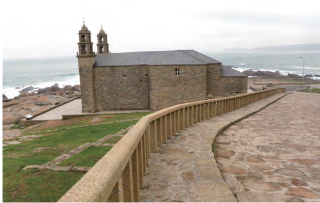
▲走到歐洲另一個盡頭Muxia教堂