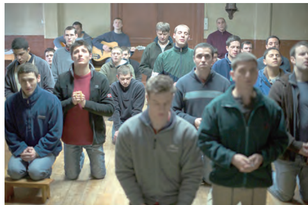
▲一起祈禱，一起作息，一起感受神的帶領，團體生活有相互支持的力量。

本片讓毒癮青年在團體的嚴格規範下，有如修道人般，過著清貧、服從、暫時沒有異性戀情的生活。這些修會生活形式，「在勞動中，參與上主造化」，如有違規、犯錯的行為，要公開道歉，遵從傳統修會「規過」的規矩等，都有「改過遷善」、「反樸歸真」之意。當每