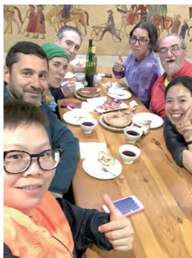
▲朝聖者共享加利西亞聞名小吃——章魚燒