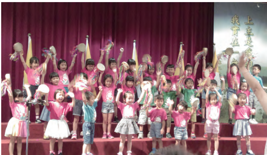
▲母佑幼兒園的小天使隊表演〈耶穌加油〉▶伯利恆基金會的慈母幼兒園表演〈雲上太陽〉