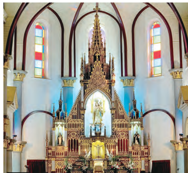
▲十月：高雄，玫瑰聖母聖殿主教座堂（1859）