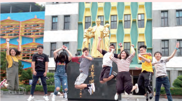
▲在青年導師鮑思高神父的態下，青年們歡喜踴躍！