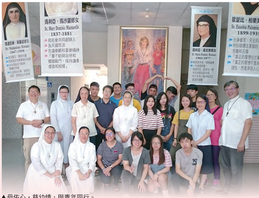
▲母佑心·慈幼情，與青年同行。