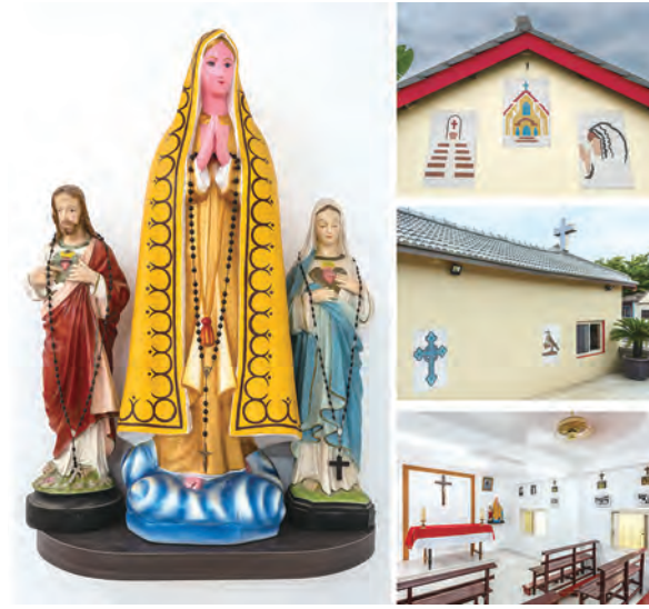
▲二月：雲林港後，聖家天主堂（1903）