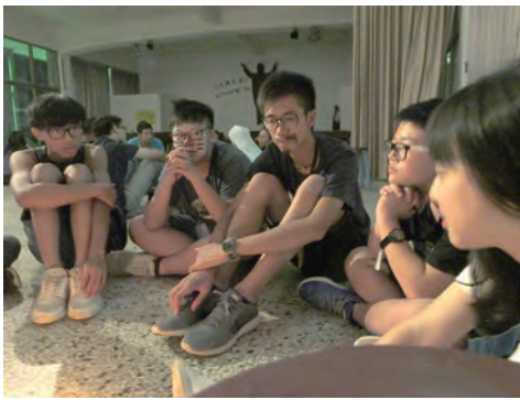
▲燭光禮——分享4天互動的心情