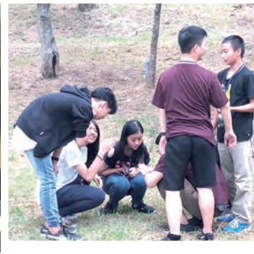
▲戶外攝影課程感受天主創世的力量