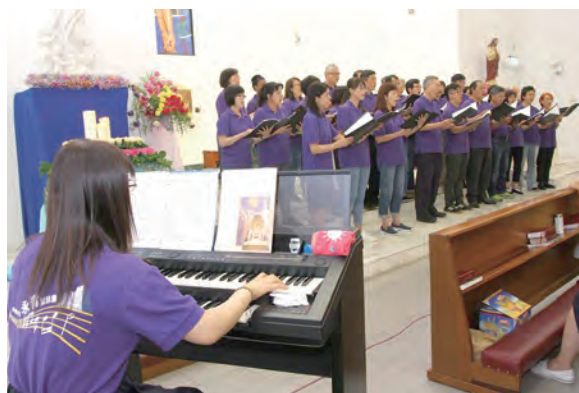
▲聖詠團演唱改編版〈奇異恩典〉，激昂和聲充滿Powerful。

主耶穌給了我們一個計畫：「愛天主和近人」（參閱瑪22:34-40）。每天為一個近人做一件事，就能活出基督的愛。成立63年的永和聖母升天堂，正以其悠久的歷史及信仰底蘊不斷蛻變，在高福南神父帶領下，不時以充滿創意、與時俱進與社會潮流接軌的方式推動福傳，成為一個凝聚與散播天主之愛的聖所。當育樂營的小朋友，以及互助國小的孩子依依不捨地揮手向我們告別時，我們知道：全能的天主不但在我們的心裡動工，也已經在他們的心裡動工。