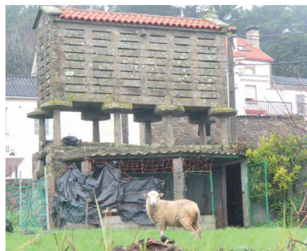
▲加利西亞獨特的穀倉建築

這條道路，不同路徑通往終點，不分你我，不分宗教信仰，有苦有樂，有痛苦有愛。做一名朝聖者，我努力學習如何與自己對話，從一步一腳印檢視自己內心是否有過錯，在那盼望得到宗教救贖之前，就要看看自己願意付出多少體力代價，一方面衡量自己肉體能承受的多少，一方面要為自己心靈的罪，願意付出什麼省悟，