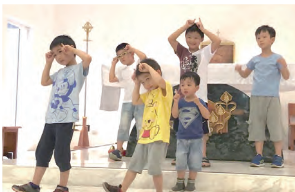
▲可愛的小羊在堂慶活動中博得滿堂彩。