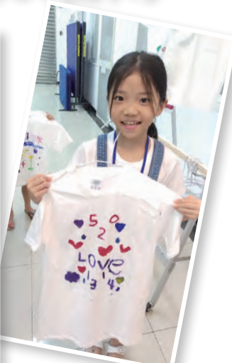
▲育樂營的小學員開心地拿著自己創作的T恤。

節目終了前，一段美麗的原住民話語突然迴盪在聖堂中，原來這是阿美族的朋友「祝福永和聖母升天堂63歲生日快樂」。就是這種在主內不分族群、不分言語的感動，連結起教友與南投原鄉孩子的真情。永和堂甫於8月2日獲新北市政府頒發績優宗教團體社會教化獎，成立南投互助國小護苗專案，正是獲獎的事蹟之一，堂慶這天，當然要邀請這些孩子與我們一同分享生日的喜悅。