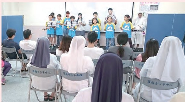
▲羅蘭中心的孩子們，呈獻精彩動聽的音樂表演。