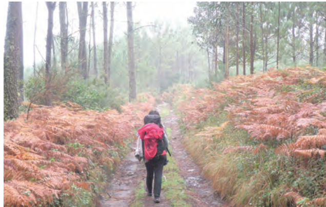
▲獨自走在「原始之路」的山林小徑 ▶「法國之路」歐洲第一條文化之路的新標誌