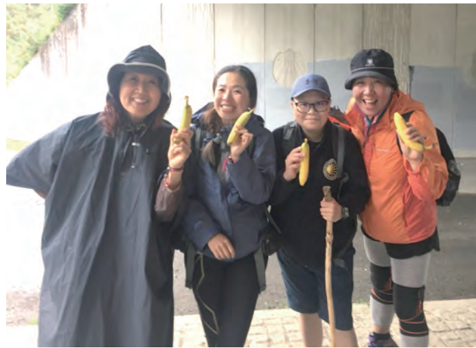
▲朝聖路上不期而遇的台灣夥伴