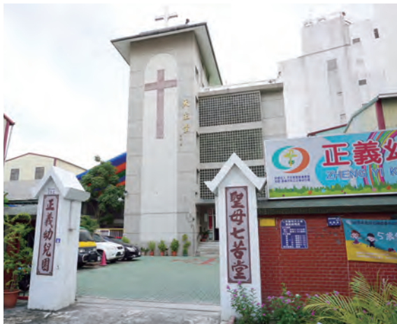
▲聖體要理講習會地點——嘉義市民生七苦聖母天主堂。