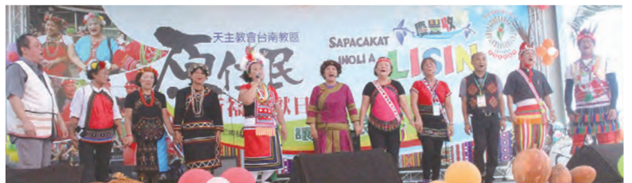
民市議員也都參與這隆重的彌撒。

10時舉行阿美族祈福禮，在阿美族中這項目只有男性可以參加，女性及小孩需避開的禁忌。結束後，大家再一起進教堂進行神聖的原住民奉獻日感恩祭典，整台彌撒幾乎都採用阿美族的方式來進行，如歌曲、語言、奉獻方式及祭品產物等，讓我們都會區的原住民不用到原鄉就能參與傳統敬拜天主的方式。感謝林吉男主教來主禮感恩彌撒，在天主的大愛中各族群大融合，我們台南市都會的兩位原住