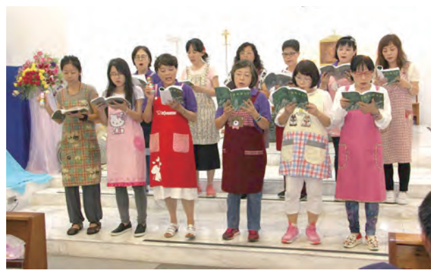
▲穿著圍裙為大家獻唱的烘焙班，有半數是望教友，欣喜共融。