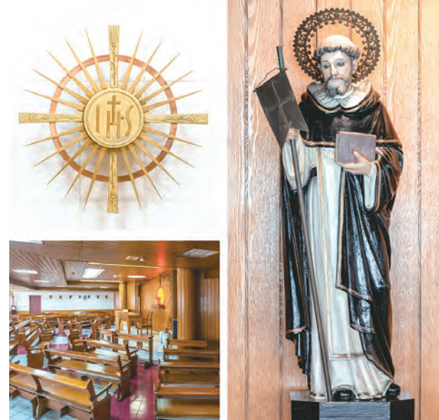
▲八月：靜修女中，真福伊美黛小聖堂（1916）