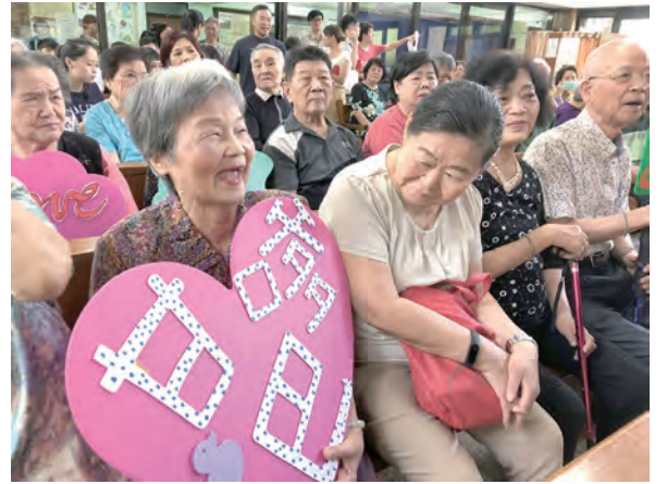
▲失智長輩高舉加油牌